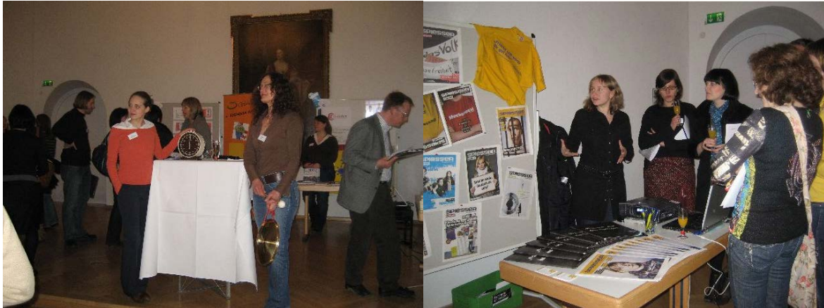
Die Uhr stets im Blick: Beim Projekte-Speed-Dating zählt der erste Eindruck.

Auch diese Methode soll abschließend kurz zusammengefasst werden: